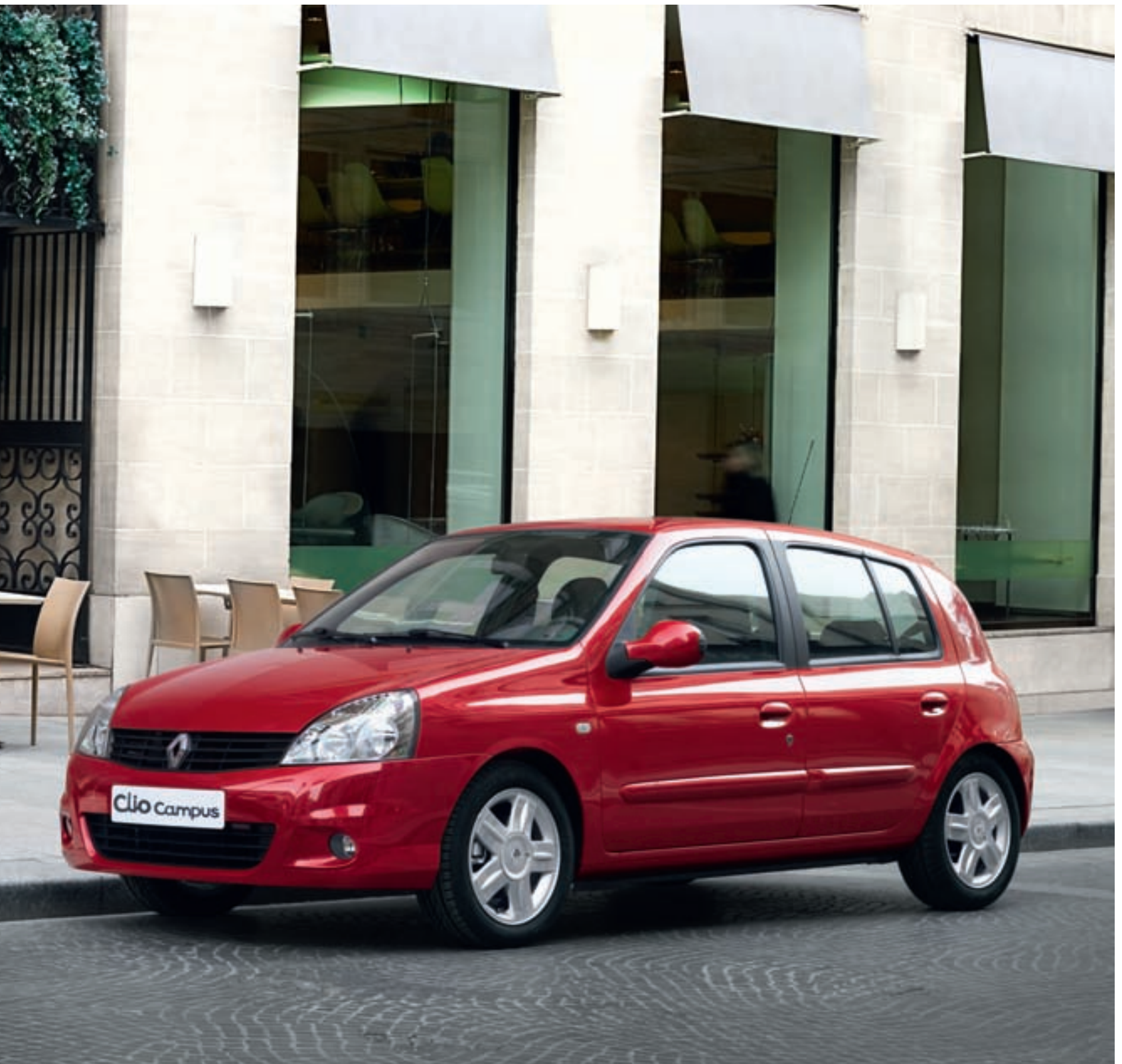
Véhicule présenté avec option jantes alu